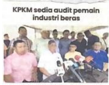
KPKM sedia audit pemain industri beras

K erajaan perlu mewujudkan pasukan petugas khas bagi memberi fokus terhadap penghapusan kartel semua jenis makanan yang dibawa masuk ke negara ini. Pakar Kriminologi, Shahul Hamid Abd Rahim berkata, hukuman berat juga perlu dikenakan terhadap syarikat atau mana-mana individu yang menjadi dalang dalam kegiatan tersebut.