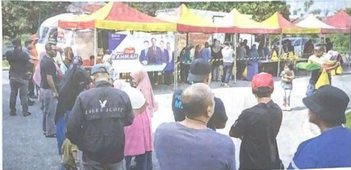
GAMBAR bertarih 25 Julai 2023 menunjukkan penduduk beratur pada Program Jualan Ehsan Rahmah (JER) di Dewan Komuniti Taman Kantan Permai, Kajang.

KERATAN AKHBAR : KOSMO TARIKH : 10 SEPTEMBER 2023 PERKARA : ISU SEMASA