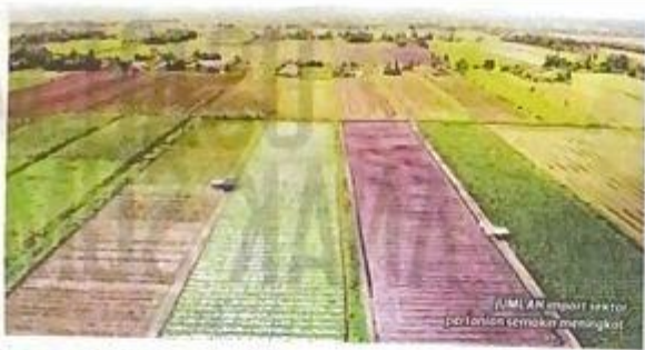
Jumlah import sektor pertanian semakin meningkat.

Jika skop pertanian mengambil kira perniagaan tani termasuk aktiviti hiliran, sumbangan sektor pertanian kepada KDKN termasuk aktiviti hiliran