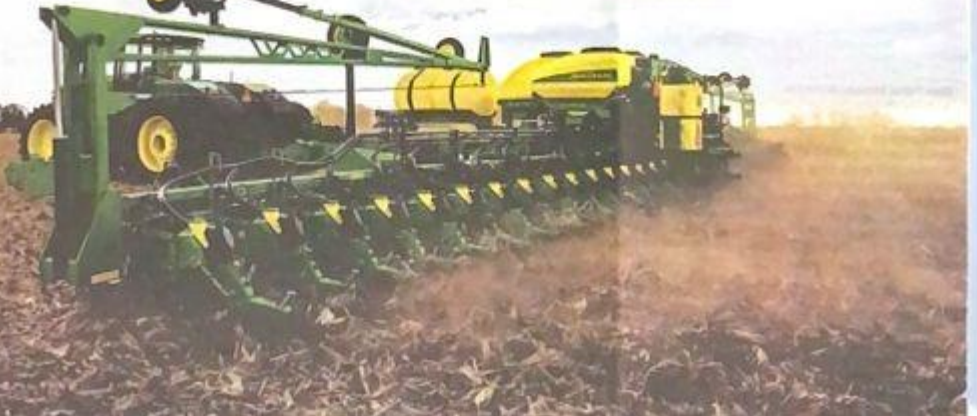
Sektor pertanian memerlukan banyak tenaga perkerja.

"Daripada segi pengeluaran, sektor pertanian di Malaysia secara amnya terbahagi kepada dua subsektor iaitu tanaman komoditi dan subsektor makanan." Kedua-dua sektor