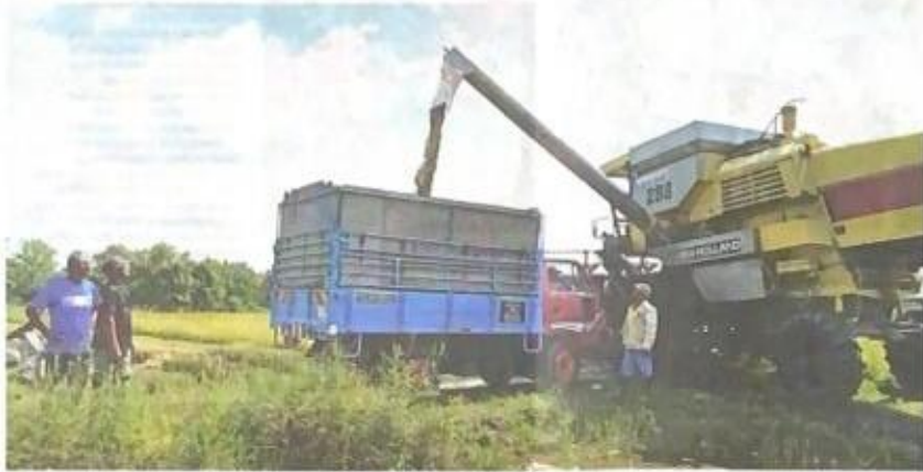
PESAWAH melihat hasil padi yang dipindahkan daripada mesin padi ke lori sebelum dibawa ke pusat jualan di Kampung Alor Radis, Arau, Perlis.

Disiplin pesawah sangat penting khususnya dari aspek pengurusan sawah seperti masa untuk proses menabur baja, racun, buang padi angin selain sistem pengairan yang baik. Bukan sahaja di Perlis direkodkan paling tinggi malah di seluruh negara."