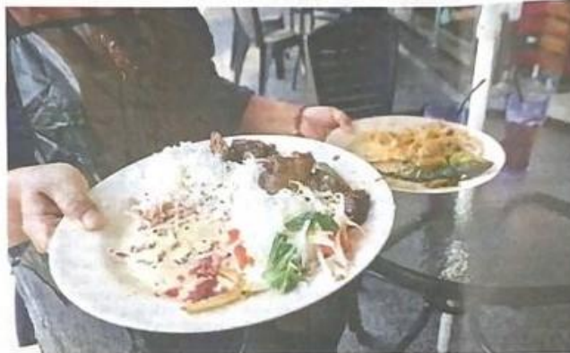
Sheer waste: Customer didn't finish their rice after a meal at one of the restaurants in Kuala Lumpur.

With prices of imported rice having gone through several revisions of late, he said business