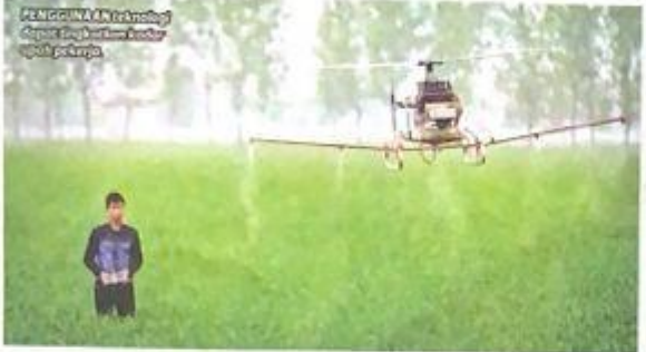
Penggunaan teknologi dapat meningkatkan hasil perkerja.