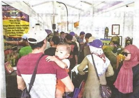
ORANG ramal membanjiri Hari Peladang, Penternak dan Nelayan Kebangsaan (HPPNK) 2023 di Ipoh semalam.

IPOH – Sambutan Hari Peladang, Penternak dan Nelayan Kebangsaan (HPPNK) anjuran Kementerian Pertanian dan Keterjaminan Makanan merekodkan transaksi berjumlah RM2,675,607 sepanjang tiga hari penganjurannya.