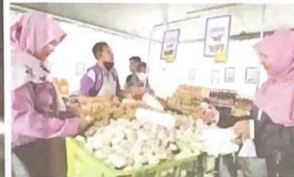
Bawang adalah antara produk yang paling laris dijual sepanjang Jualan Agro Madani HPPNK 2023.