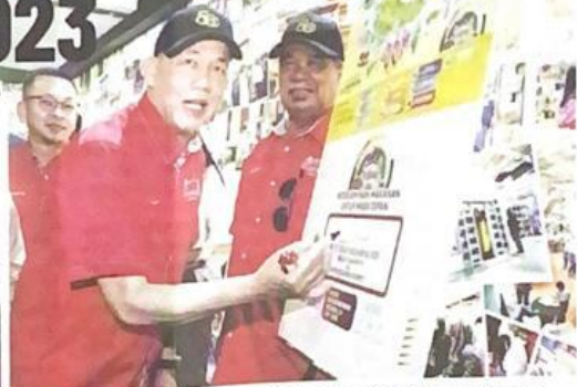
Timbalan Perdana Menteri, Datuk Seri Fadillah Yusof menandatangani plak rajah karnival selepas merasmikan HPPNK 2023 di Bulatan Sultan Azlan Shah, Meru Raya di Ipoh.