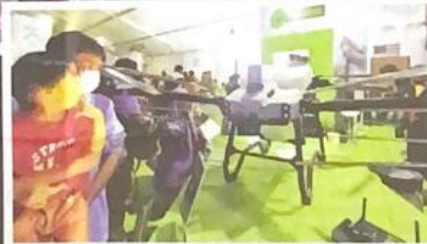
Pengaplikasian teknologi baharu seperti dron dalam sektor pertanian menarik perhatian pengunjung terutama kanak-kanak.