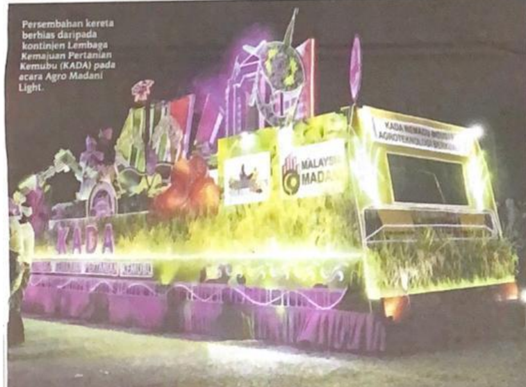
Persembahan kereta berbias daripada kontinjen Lembaga Kemajuan Pertanian Kemubu (KADA) pada acara Agro Madani Light.