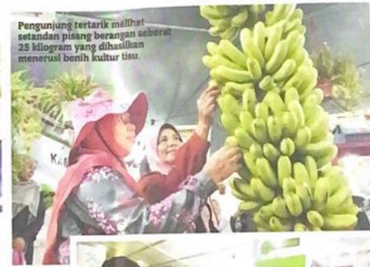
Pengunjung tertarik melihat setandan pisang berangan seberat 25 kilogram yang dihasilkan menerusi benih kultur tisu.