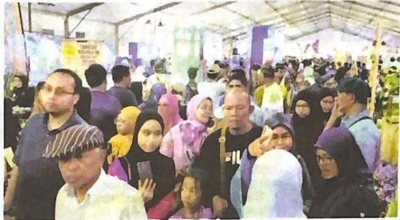
Karnival HPPNK yang juga ekspos pameran dan jualan pertanian kedua terbesar negara mendapat sambutan luar biasa dengan kehadiran lebih 500,000 pengunjung dari seluruh negara.

Dia yang bergiat aktif dalam pertubuhan bukan kerajaan (NGO) berhasrat mengaplikasikan teknik baharu tanaman di sekolah dan komuniti setempat supaya lebih