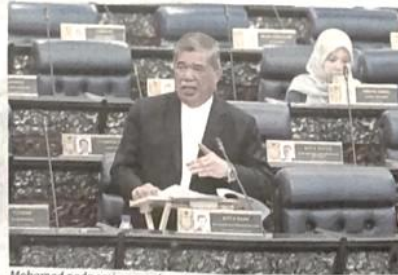
Mohamad pada sesi penggulungan perbahasan usul Kajian Separuh Penggal RMK12 di Dewan Rakyat, semalam.

Sementara itu, Mohamad, berkata penyertaan belia dalam sektor pertanian masih rendah, iaitu merangkumi 37 peratus daripada komposisi tenaga buhuh pertanian.