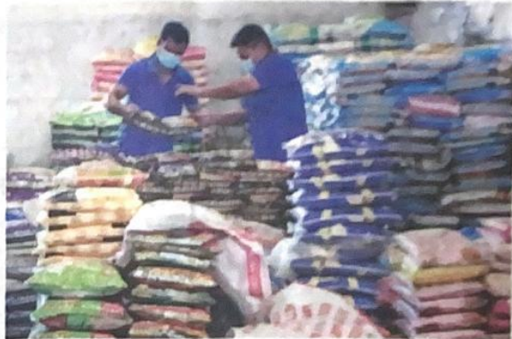
Stok bekalan beras negara kini adalah sebanyak 900,000 tan metrik.

"Sehubungan itu kementerian berpandangan bahawa masih belum terdapat keperluan mendesak yang bersifat kece-