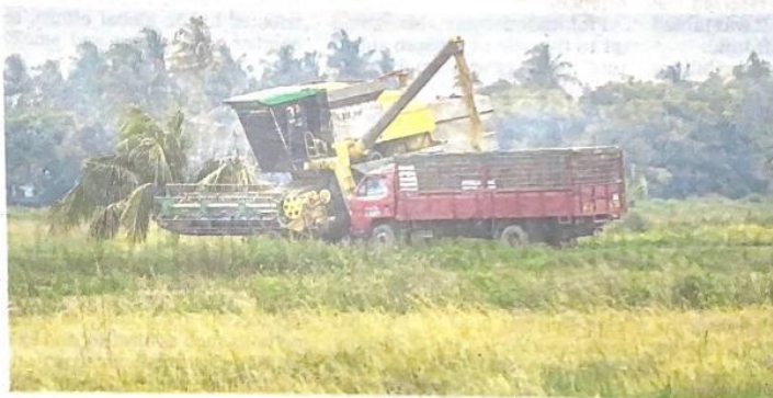
A harvesting machine in a paddy field near Butterworth, Penang, recently. A government scheme aims to increase padi yield to seven tonnes per hectare.

"This is sufficient to cover the country's rice needs for four to