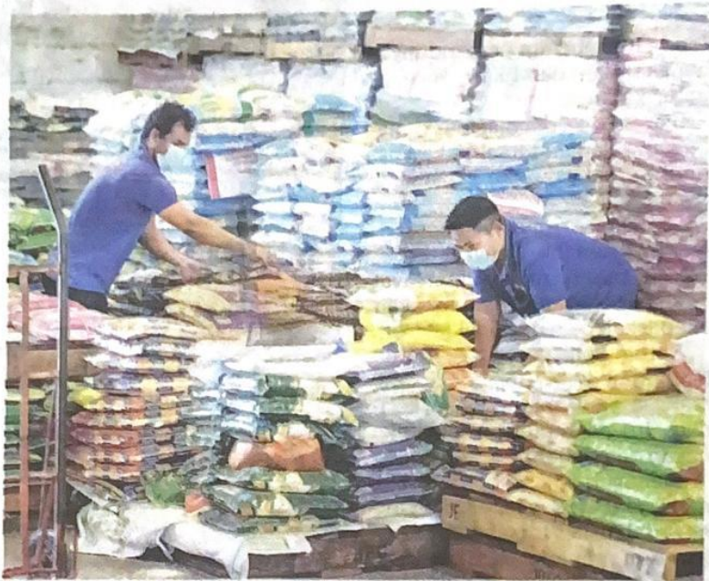
KERAJAAN beri jaminan bekalan beras negara masih mencukupi untuk menampung keperluan bagi tempoh lima bulan. – GAMBAR HIASAN.

"Antara inisiatif yang dilakukan adalah pelaksanaan program SMART Sawah Berskala Besar (SMART SBB) yang menyasarkan pelaksanaan di kawasan seluas 150,000 hektar sawah padi dengan purata pengeluaran hasil sebanyak tujuh tan per hektar," katanya ketika menggulung per-