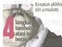
Keratan akhbar BH semalam.

"Gudang yang tidak terletak di bawah kawal selia dan bidang kuasa FAMA perlu diwujudkan di bawah agensi baharu iaitu Agensi Keterjaminan Ma-