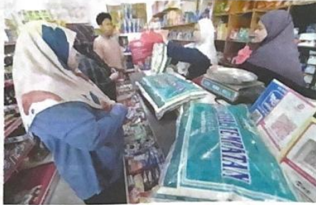
Penduduk kampung mendapatkan bekalan Beras Special Tempatan 10 kilogram dengan harga RM26 sekampit ketika tinjauan di Agro Bazaar Kampung Jalan Kebun, Seksyen 30, Shah Alam.

Menurutnya, daripada situ, tindakan lebih tegas dan berkesan boleh diambil, di