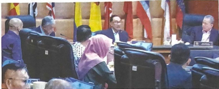
ANWAR Ibrahim mempengerusikan Mesyuarat Majlis Tindakan Sara Hidup Negara (NACCOL) di Putrajaya semalam.

Sebanyak tiga Kertas Pertimbangan dan dua Kertas