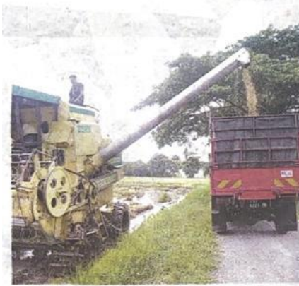
PENCELUARAN enam tan padi per hektar mampu memenuhi sasaran kadar sara diri beras negara sebanyak 80 peratus. - GAMBAR HIASAN

"Pada 2021, seramai 96 penternak muda menerima bantuan bernilai RM1.92 juta, manakala pada 2022, seramai 77 penternak muda mendapat bantuan berjumlah RM1.54 juta," katanya.