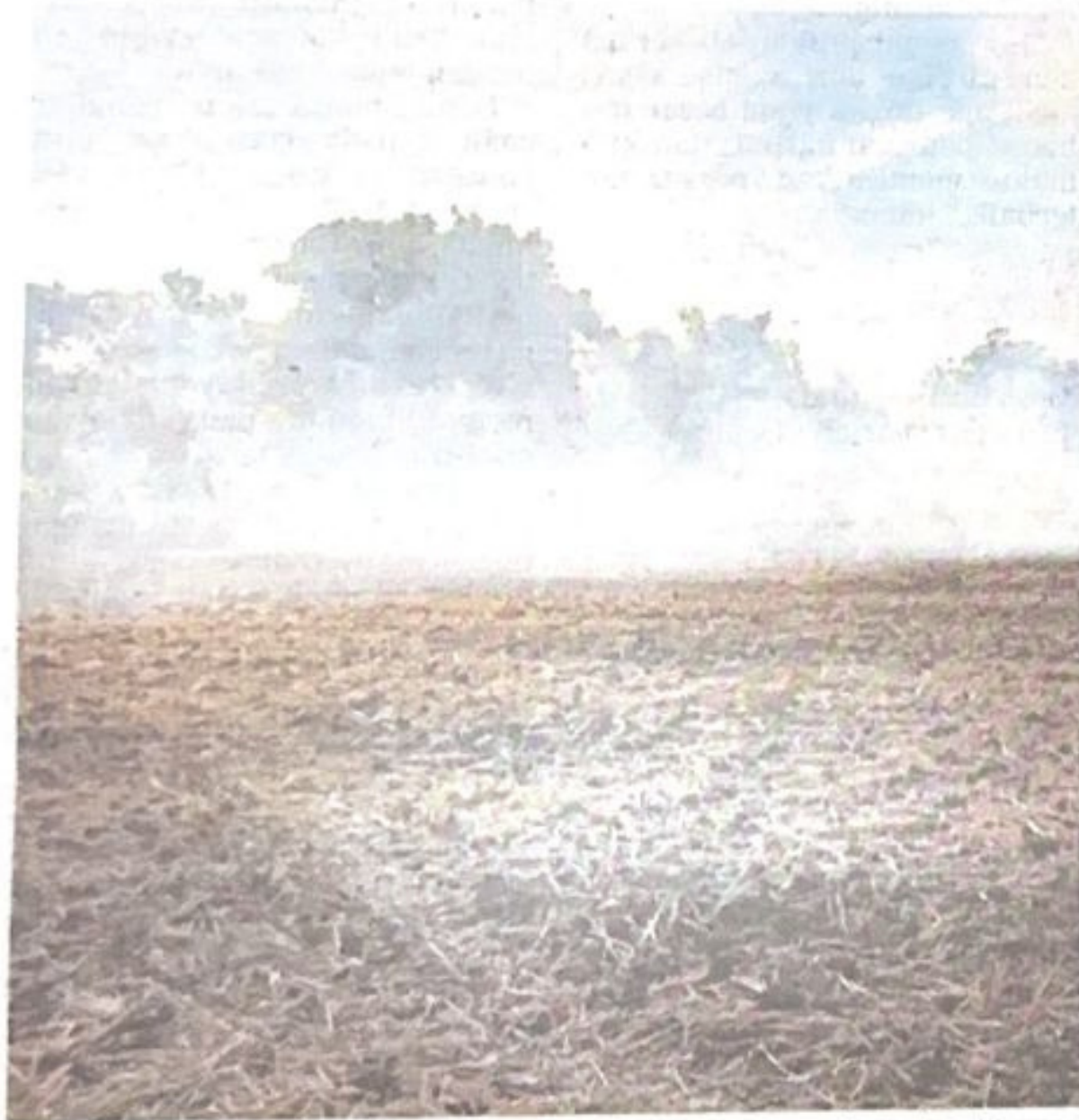
Keadaan sawah padi yang kering kontang dan tanah merekah di Balik Pulau berikutan fenomena cuaca panas melanda negara.

Kuala Lumpur: Cuaca panas di kawasan utara baru-baru ini sebenarnya keadaan biasa berlaku di kawasan Pantai Barat Semenanjung Malaysia menjelang hujung bulan Januari hingga Februari.