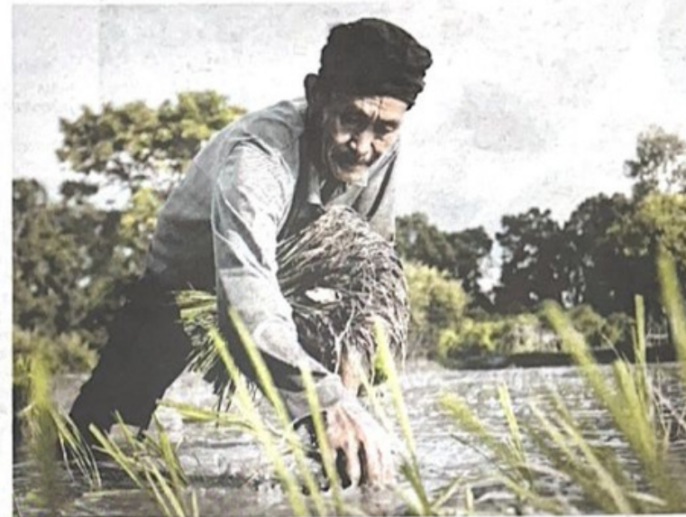
RAMAI petani beranggapan tidak perlu menunaikan zakat kerana hidup serba kekurangan namun jika cukup syarat, mereka wajib melaksanakannya.

ZAKAT pertanian tidak semestinya hanya tertumpu kepada tanaman padi semata-mata.