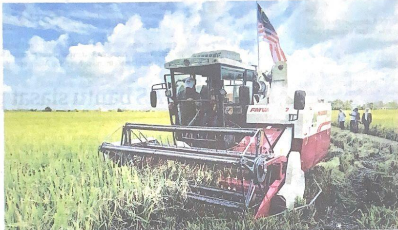
MOHAMAD Sabu menaiki mesin padi untuk proses pengambilan padi di Projek Smart Sawah Berkala Besar (Smart SBB) Mini Sekinchan Mada Kampung Lat 1,000, Arau, Perlis semalam.

Mengikut data 2021, negara hanya menghasilkan 1.7 juta tan metrik beras setahun. Mengikut rekod pada 2022 pula, Malaysia terpaksa mengimport 1.11 juta tan metrik beras membabitkan dari negara seperti Vietnam, 37.2 peratus, Pakistan (36.99 peratus), Thailand (12.9 peratus) dan India 8.6 peratus atau se-